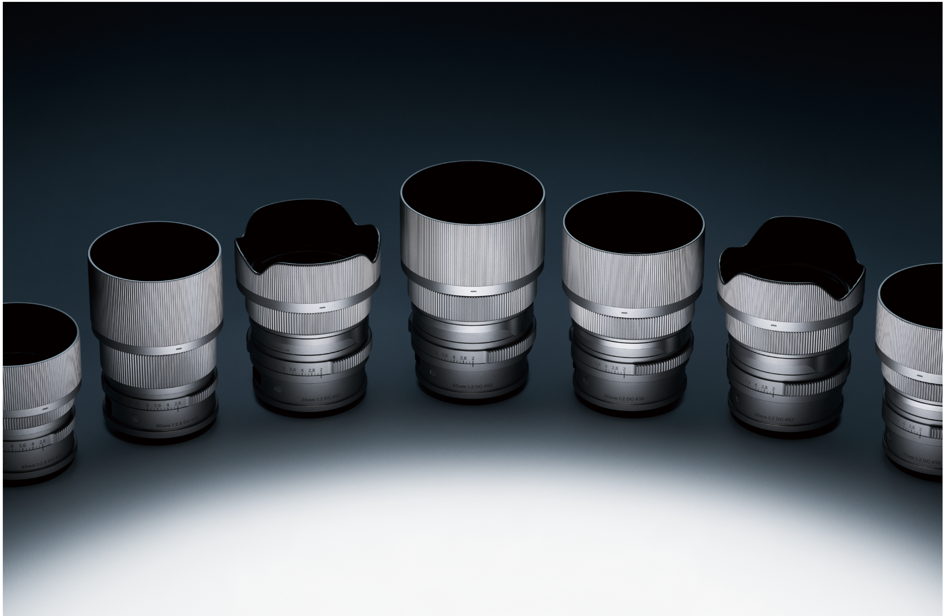
Contemporary, I series