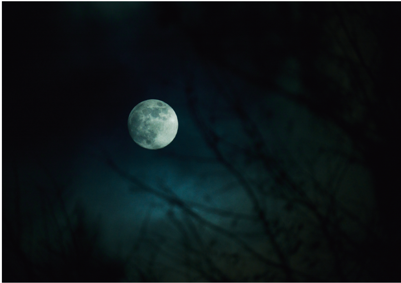
16-300mm F3.5-6.7 DC OS | Contemporary 300mm, F6.7, 1/100s, ISO800 Mina Daimon