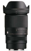
16-300mm F3.5-6.7 DC OS Mounts: L-Mount, Sony E-mount, FUJIFILM X Mount, Canon RF Mount