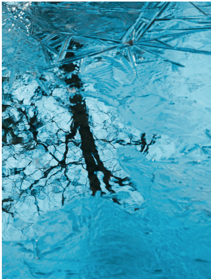
16-300mm F3.5-6.7 DC OS | Contemporary 77mm, F6.0, 1/100s, ISO250 Mina Daimon