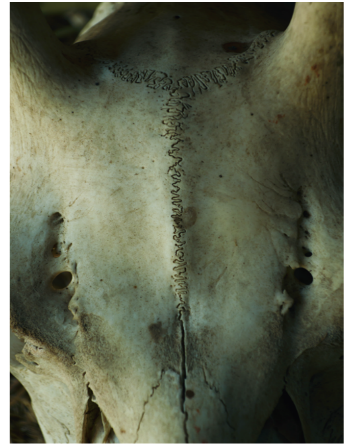
16-300mm F3.5-6.7 DC OS | Contemporary 69mm, F5.8, 1/100s, ISO500 Mina Daimon