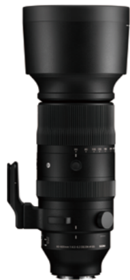
60-600mm F4.5-6.3 DG DN OS Mounts: L-Mount, Sony E-mount