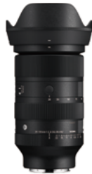
28-105mm F2.8 DG DN Mounts: L-Mount, Sony E-mount