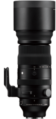
150-600mm F5-6.3 DG DN OS Mounts: L-Mount, Sony E-mount