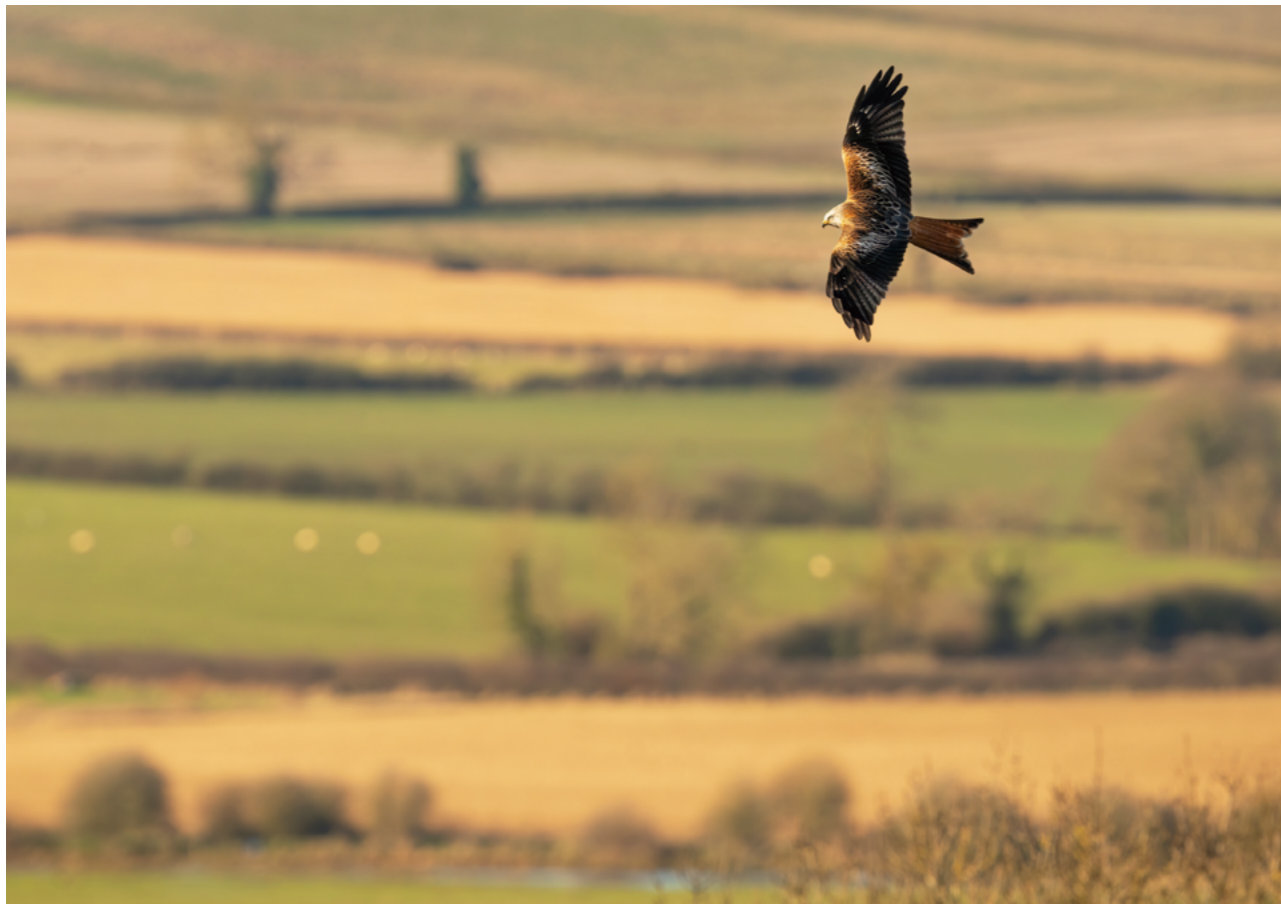
300-600mm F4 DG OS | Sports 600mm, F6.3, 1/1600, ISO800 Andrew James