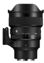
14mm F1.4 DG DN Mounts: L-Mount, Sony E-mount