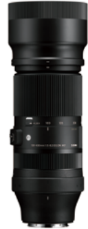
100-400mm F5-6.3 DG DN OS Mounts: L-Mount, Sony E-mount, FUJIFILM X Mount