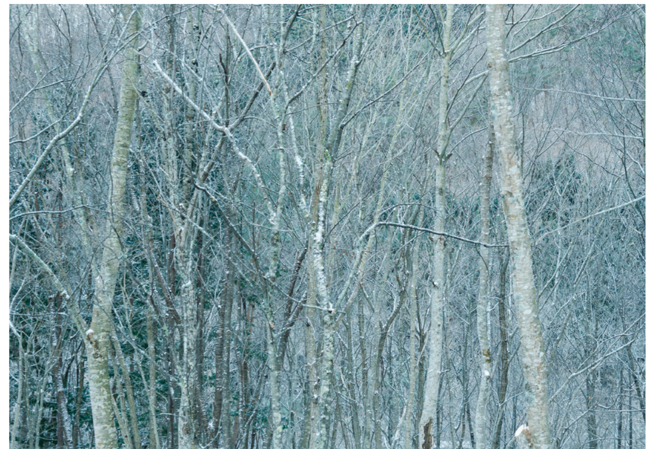
16-300mm F3.5-6.7 DC OS | Contemporary 45mm, F5.8, 1/500s, ISO1250 Mina Daimon