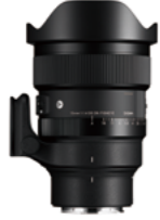
15mm F1.4 DG DN DIAGONAL FISHEYE Mounts: L-Mount, Sony E-mount