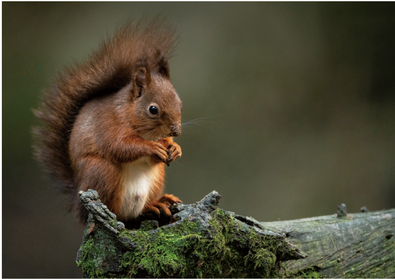
300-600mm F4 DG OS | Sports 600mm, F4.5, 1/160, ISO6400 Andrew James