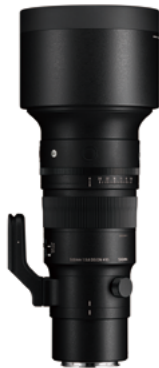
500mm F5.6 DG DN OS Mounts: L-Mount, Sony E-mount