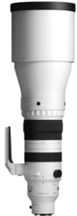
300-600mm F4 DG OS Mounts: L-Mount, Sony E-mount