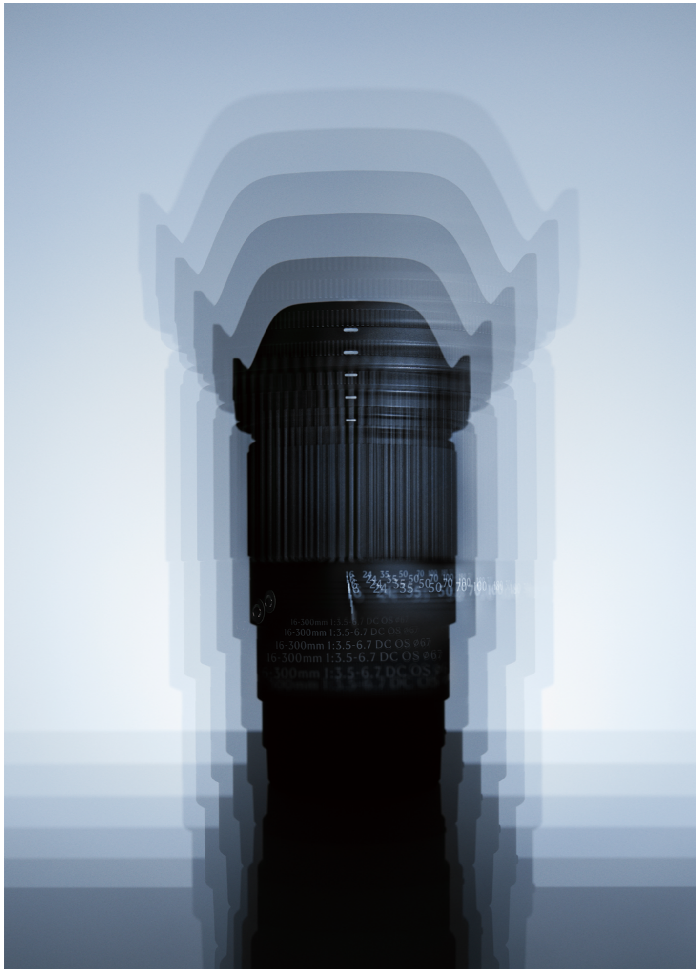
16-300mm F3.5-6.7 DC OS | Contemporary