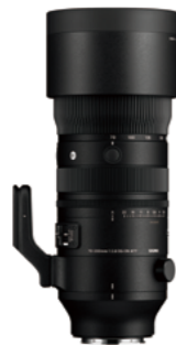
70-200mm F2.8 DG DN OS Mounts: L-Mount, Sony E-mount