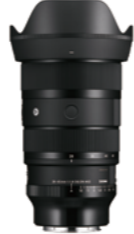
28-45mm F1.8 DG DN Mounts: L-Mount, Sony E-mount