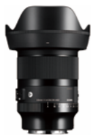
20mm F1.4 DG DN Mounts: L-Mount, Sony E-mount