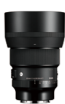
85mm F1.4 DG DN Mounts: L-Mount, Sony E-mount