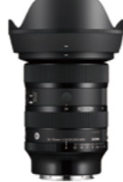
24-70mm F2.8 DG DN II Mounts: L-Mount, Sony E-mount